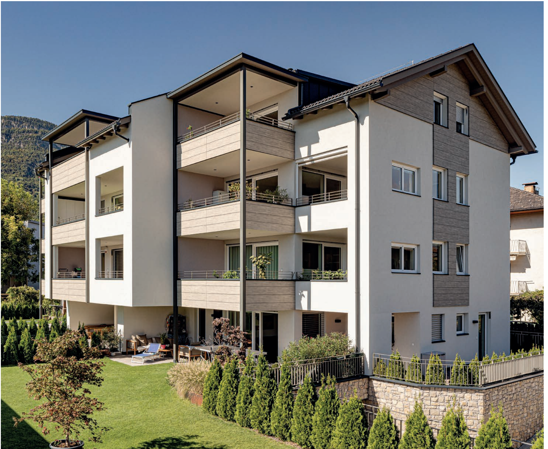
2018 Residence SILLWEG – Appiano Cappotto - Intonaco - Massetto